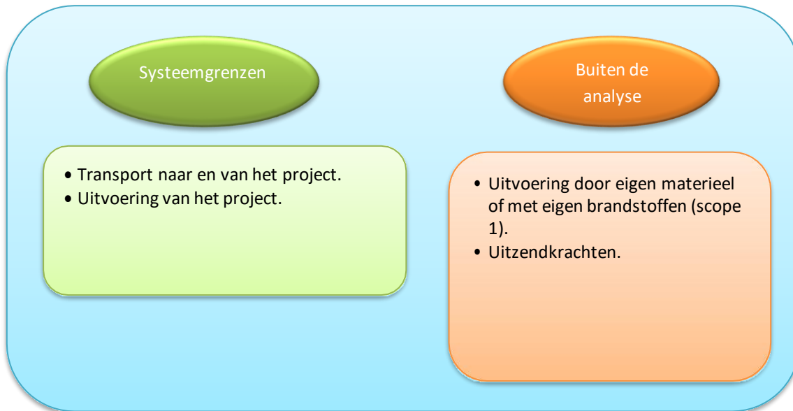
Figuur 5: Inkadering van de systeemgrenzen

Emissies die meegenomen worden in de ketenanalyse zijn weergegeven in onderstaande figuur. De belangrijkste emissiebronnen zijn: